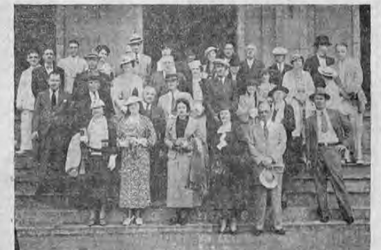
La foto muestra a un numeroso grupo de turistas norteamericanos que estuvieron en esta capital durante las fiestas de fin de año.